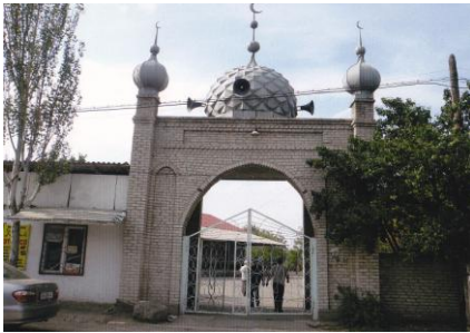
トウクルダシのアク・ミジツ