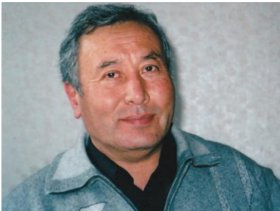
第3代主席ロウズイメメット・アブドゥバキエフ