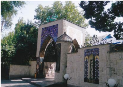
ウイグルレストラン。キルギスでは飲食業を営むウイグル人が多い

カザフとキルギスでは、ウイグル人居住地についても様相は、かなり異なっている。移民してきた時期が清末か中華人民共和国成立以降かを問わず、カザフのウイグル人はアルマトイ及びジャルケントにほぼ集中して暮らしているのに対し、キルギス共和国のウイグル人は国内各地に点在して暮らしており、清末に新疆から移住してきたウイグル人は オシシュ郊外 （カシュガル人が多数）や カラコル （タランチ。イリからの移民が比較的多い）などの農村や地方都市に多く、彼らは主に農業に従事している。一方で首都 ビシュケク及びその近郊 に住むウイグル人は1950～60年代にやってきた者が多く、ソ連政府が パクロフカ、アラムディン、マラウディン、トゥクルダシ などに工