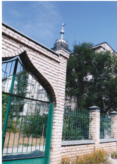
アラミディン・ウイグル団地マスジツの門と、後ろは団地群