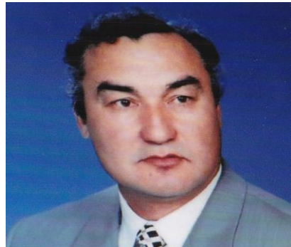
第2代主席ニグメット・バサコフ