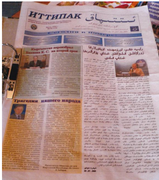
ウイグル語新聞『イッティパク』