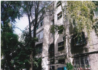
ビシュケク郊外アラミディンのウイグル団地

アラミディンには「ウイグルスキコワダラット（ウイグル人区画）」と呼ばれるウイグル人が集住する団地があり、ここは1981年トウクルダシ（ビシュケク中心部の「セントラルミジッティ＝中央モスク」から近い場所）の区画整理をした際に、道路拡張工事などで住めなくなったウイグル人たちが割り当てられ、移住したことに始まる。