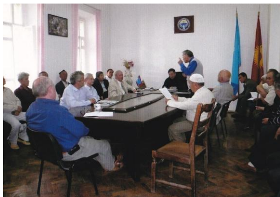
ウイグル人組織「イッティパク」のジギトベシ・アクサカル会議

キルギスのウイグル人組織「イッティパク」の下にはジギトベシ・アクサカル会議があり、不定期にウイグル人各マハッラのジギトベシやアクサカル（長老）が全国から集まって、会合を持っている。ジギトベシやアクサカルはビシュケク一帯で15名ほど、全国では35名ほどの数だという。