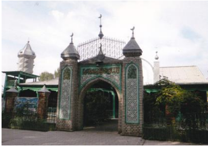
パクロフカのドスルク・マスジツ