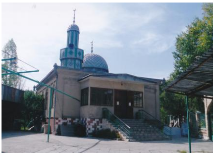
アラミディン・ウイグル団地マスジツ 1992年に建設された