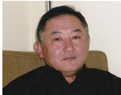
第4代主席ディリムラット・アクパロフ