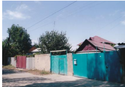
ビシュケク郊外ウイグル村リビディノフカの風景