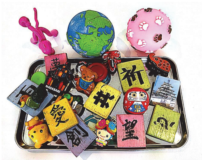
「共創空間」で使用しているマグネットとボール 表紙デザイン&イラスト 和泉直子